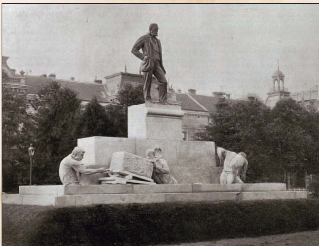
Gróf Tisza Lajos szobra Szegeden — Fadrusz János alkotása (Archív)

Most is a halála utáni első közgyűlésünkön, amikor szívünk egész bensőségével, hálával és kegyelettel adózunk dicső emlékének, szelleme itt van közöttünk és késő unokáink között marad addig, amíg a magyar erdész szíve nemzetéért, királyért, s a hazáját védő erdős bérczekért dobogni tud! Úgy legyen!