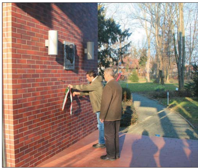
Koszorúzás a Saághy-emléktáblánál