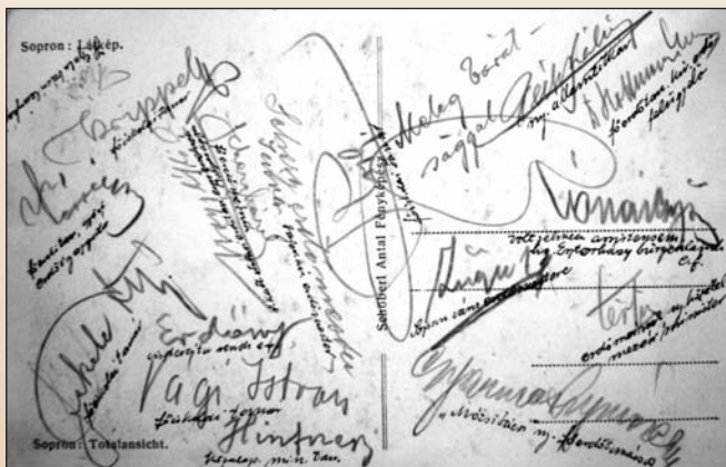
1. kép. Sopron: Látkép. Schöberl A. fényképész. 1926 táján és a hátlap