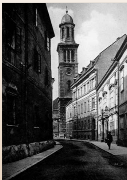
3. kép. Templom utca. 1926 táján