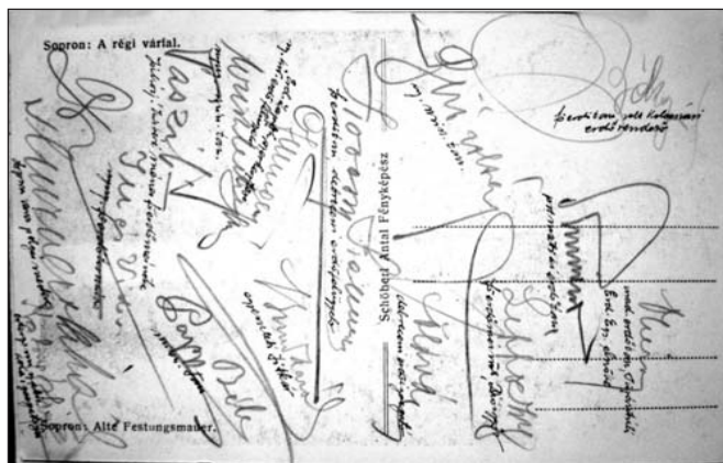
2. kép. A régi várfal. Schöberl A. fényképész. 1926 táján és a hátlap

számos értékes szakmai anyag maradt rám. Számomra egyik kedves emlék az OEE első soproni közgyűléséhez kapcsolódik. Az országos gyűlés résztvevőjeként soproni képeslapok (Schöberl A. fényképész munkái 1926 táján) hátlapjára aláírásokat kért kollégáitól, barátaitól. A személyek majdnem teljes körű beazonosítását segítették olvasható kézírásával írt megjegyzései.