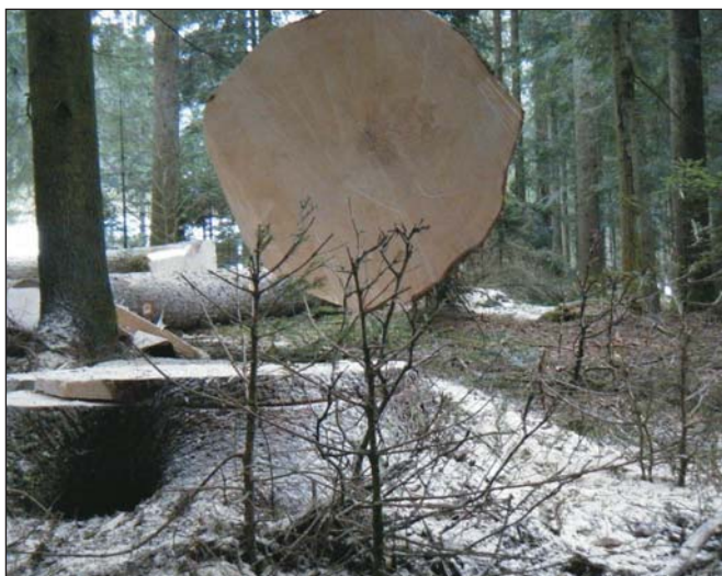
Az erdőnek rágalatlan újulatra van szüksége