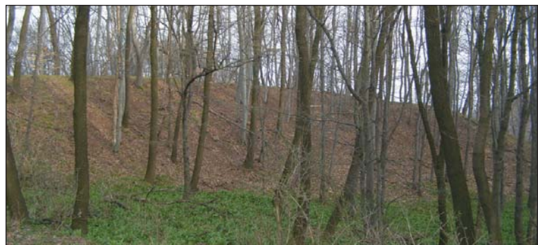
A vaskori földvár sánca

Kultúrák jöttek-mentek, de az erdővel borított hegytetőn az értékes ivóvíz megmaradt. Jól jelzi ezt, hogy a korai Árpád-korban középkori falu élte életét a hegy magasán. Templomának titulusa Szent Jakab lehetett, melyről a hegy a későbbi nevét nyerte. 1225-ben Bertalan pécsi püspök egybegyűjtötte a Mecsekerdőben élő remeteket és az Árpád-kori templomra alapozva kolostor építésébe kezdett számukra a Jakab-hegyen.