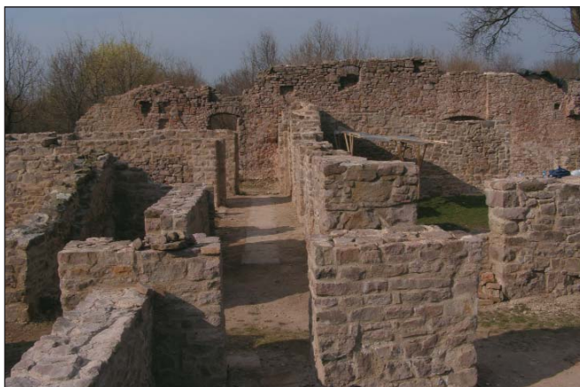
A Pálos kolostor romjai a Jakab-hegyen

A Mecsek hegység nyugati felének őrt álló bástyája – Pécsről alig egy macskaugrásnyira – a Kővágószőlős és Kővágótőtös felett emelkedő Jakab-hegy. A Nyugati-Mecsek legmagasabb hegycsúcsát felépítő kőzettömeg egy része a földtörténet ókorában, a perm korban alakult ki, jellegzetes színű vörös homokkő. A hegy déli peremén emelkedő merész sziklatornyok – a Babás-szerkövek, mint például a Zsongorkő – is ennek a kőzetnek a későbbi gejzírkitörésekből származó, kovasavas oldatokból összecementált válto-