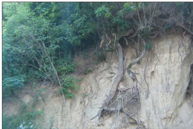
Az erdő talajvédelmi jellege egyértelmű

dőtelepítések) fajajait, ami jórészt szintén akác. Nem területesedik számos akác facsoport, hagyásfa és az adattárból 2009 óta kiejtett 0,5 ha-nál kisebb, önálló és elkülönült földrészleten található akácos, ami legfeljebb faj nélküli fásításként jelenik meg. Nyoma sincs a kiritkuló homoki tölgyesek akác cserjeszintjének és sorolhatnám tovább. Ott lehet az akác akár 6-700 ezer ha-on is.