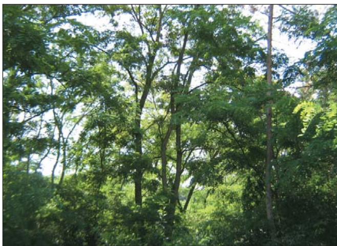
Azonnal véghasználni kellene

Különösen érdekesek az 5. pontban foglaltak, „az akácosok termőhelyének 93,7%-a természetes erdő termőhely”. Erdő az, amit a köznyelv erdőnek hív és a jogszabályok annak deklarálnak. Nálunk így van, másutt meg máshogy van (pl. mediterrán vidékek). Magyarországon a kettő nincs összhangban. Az erdőssztyep neve szerint és valójában sem erdő. Ebben a klímában ~ 150 ezer ha akácosunk áll valami helyett, ami esetleg 30-50% fás borítású, akár fehér nyáras-borókás legelő. Mármost az lenne, ha bírnánk kellő számú legelő állattal. Az erdész az az ember, aki minden üres m 2 -re azonnal egy csemetét álmodik, ha ésszerű, ha nem. Biztos, hogy ez helyes megközelítés?