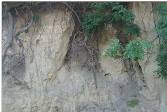
Leszakadó löszfal az erdő batárán