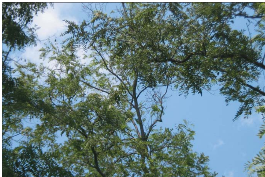
Túlgyéritett és csúcscsárádó idős akácok

Az akác tényleges mennyiségét nem látjuk tisztán, mert az Országos Erdőállomány Adattár nem szerepelteti a szabad rendelkezésű erdők (benné tömegesen egykori zártkertek és önerős er-