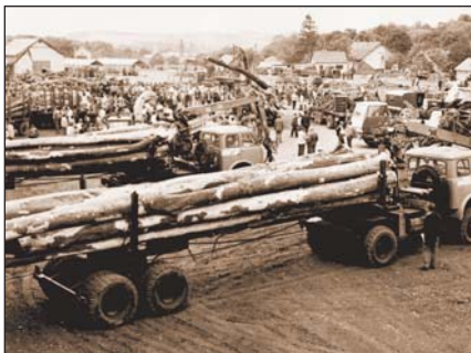
A szilvásvárad gépbemutató

55 traktort szovjet kötélpályával felszerelve. A szilvásvárad alsórakodói telephelyen nagyszabású gépbemutatót tartottak, ahol a gépek, szállító járművek egész arzenálját vonultatták fel a vándorgyűlés tiszteletére. Voltak ott hosszúfás szelvények mindenféle változatban, rakodói anyagmozgatók, elektromos fűrészek, KR-2-es egri forgógyűrűs kérgező, tűzifahasító és aprítékkészítő gépek (fotó). Ez a nagyszabású gépbemutató már a „Fagazdasági Műszaki Napok” keretében zajlott, ezzel együtt a rendezvény háromnaposra bővült.