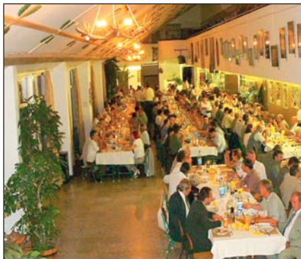
A baráti találkozó (2003)

A baráti összejövetel hangulatát talán jól érzékelteti az itt bemutatott fotó.