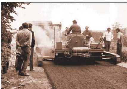
Aszfaltfinisher a Bükk-fennsíkon

A Jávorkúti úton mutatta be az erdőgazdaság saját útfenntartó rendszerét, ami egy lengyel finisherből, vibrációs hengerből és kátyúzós gépből állott (fotó). Mindezt kiegészítette a bitumentároló és aszfaltkeverő gép Felnémeten. Az útfenntartás 1974-ben már égető kérdéssé vált, a '60-as évektől sorra épültek bitumenes pályaszerkezettel ellátott utak, a legidősebbek már elérték a 15 éves kort, a nagy forgalmú utak karbantartást, felújítást igényeltek.