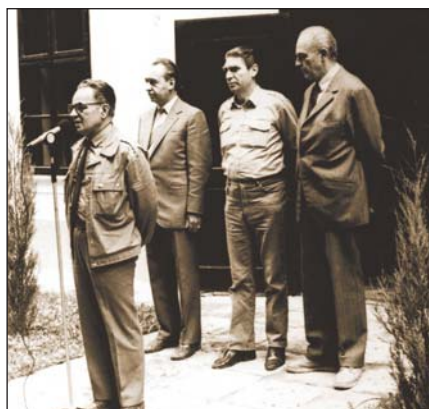
Az Erdészeti Múzeum avatása