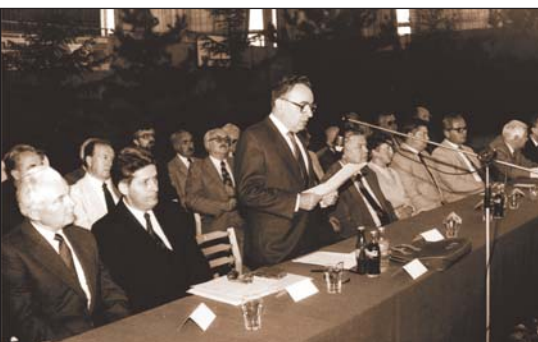
A közgyűlés (1985)