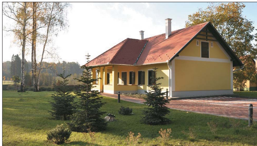
Studinka László Természetismereti Központ