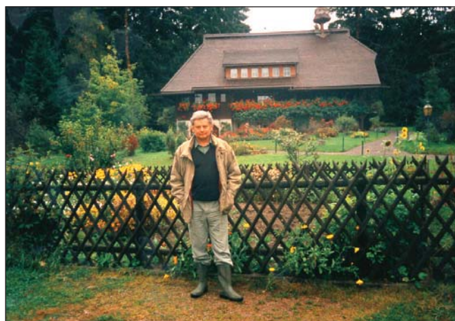
Brinkmann professzor filmbeli lakóbáza

A köztük eltöltött három hét után élmények sokaságával tértem haza, mindezeknek csupán töredékére, néhány emlé-