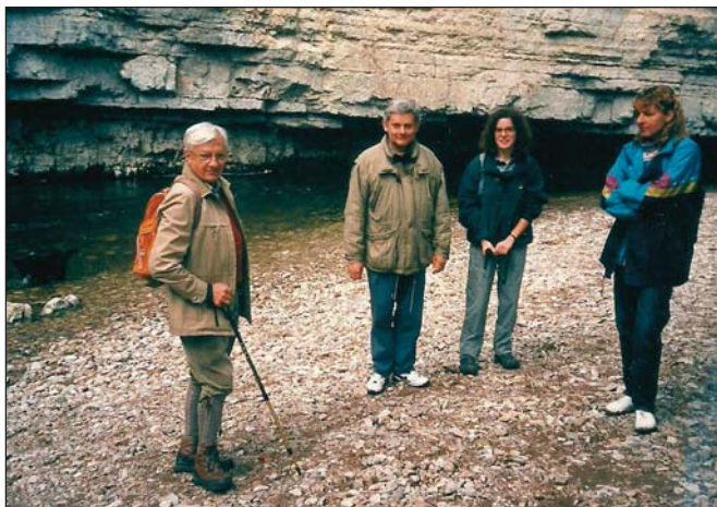
A Dübös-folyó völgyében

A megvalósítást nehezíti, hogy a jelentékeny őzállomány károkat okoz az erdősítésekben, és jellemzően a jegenyefenyőt kedveli. Ellene többféle módszert alkalmaznak, elsősorban bekerítik a kitett területeket, de ritkán egyedi védelmet, hálóból készült ún. nadrágot is használnak.