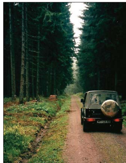
Lucfenyvesek a Fekete-erdőben

Az egykori egészséges fafajarány akkor kezdett felbomlani, amikor a 18. században a jegenyefenyő iránti igény megnőtt, főleg a hajóépítéshez és a hollandiai cölöpalapozáshoz használták előszeretettel. Nagyobb területeket vágtak tarta, és ezeket gyakran a luccal erdősítették újra. Létrehozták a nagy lucfenyő monokultúrákat – ez főleg a 20. század elején történt –, kialakultak a Fekete-erdőre sok helyen még ma is jellemző lucosok. A szemlélet az 1970-es években változott meg, amikor az elegendő erdők hátrányai markánsan megmutatkoztak. A sekélygyökerű lucfenyő állományokban nagy károkat okoz a vihar, emellett ki vannak téve különféle rovarkártevőknek, emiatt kell gyakran tarvágást alkalmazni, amit egyébként már lehetőleg elkerülnek. Az új