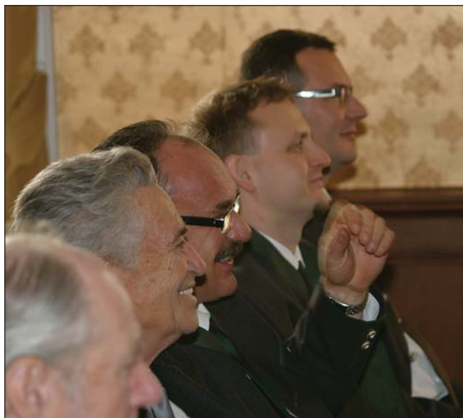
A zalai küldöttek