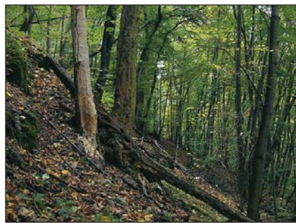
Holtfás erdő a Naszályon (MTM)

Az eljárások során gyakorlatilag egyetlen megoldatlan probléma ma-