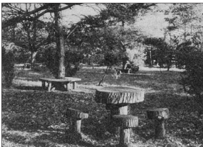
Autóspibenő Vas megyében. Az Erdő, 1967. május: Cebe Zoltán: Autóspibenők létesítése, 217.o.