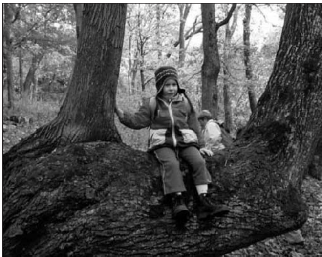
Tanösvény-avatás a Hajagban. E.L. 2009. december: Bús Mária: Tanösvény-avatás a Hajagban, 376. o.

Lássuk tehát a válogatást és lássuk benne a történelmünket és magától értetődően (ezt szoktuk „persze”-nek írni) önmagunkat.