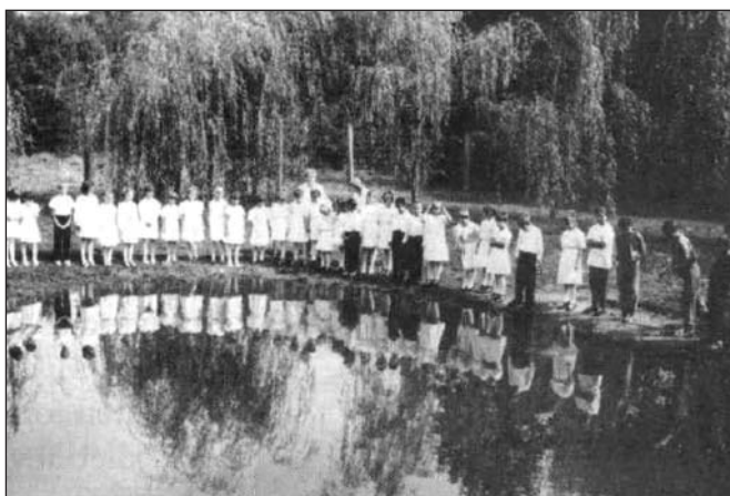
A természet visszatükrözi az ember cselekedeteit E.L. 1999. november: Az Erdők Hete 1999, 347.o.

„Az Országos Állatvédő Egyesület, mely a Madarak és Fák Napjának 1906-ban történt rendszeresítése óta a néptanítókat a nap ünneplésére alkalmas utmutatásokkal és előadási mintákkal látja el, három év óta a tanügyi hatóságok támogatásá-