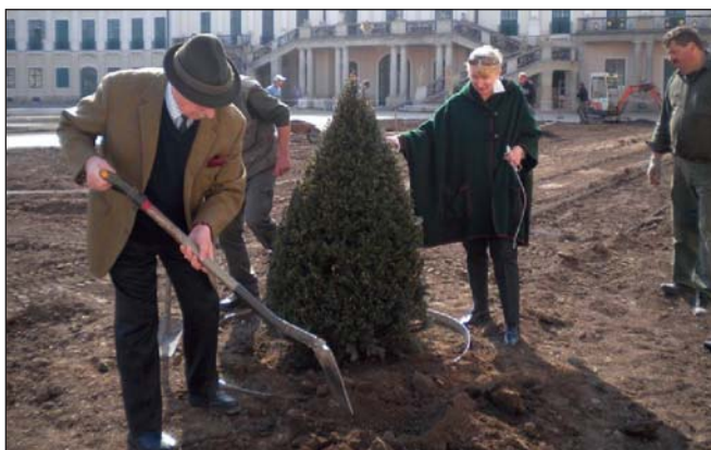
7. kép. Tiszafa Eszterháza kastélyának megújuló díszudvarában