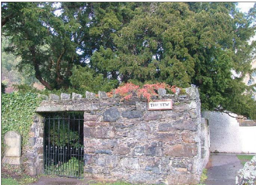
1. kép. A Pertsbireben található fortingalli rangidős európai tiszafa

A fatisztelet alapja a fák szilárdsága, időtállósága, több emberöltőnyi léte. A fák hosszú élettartamukból adódóan az állandóságot jelentik, ugyanakkor a természet folytonos körforgását is mutat-