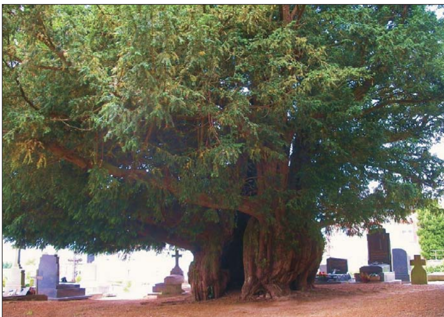
2. kép. A normandiai tiszafa-matuzsálem

ton élő fáknál. Ennek alapja, hogy a görög mitológiában a Styx folyó és az ezt kísérő növényzet a halál és élet határmezsgyéjét jelenti, s lám, Erdődy szerint a görög mitológiában a Styx és az Acheron partján Taxus díszlik. A tiszafát azonban nem élőhelye, hanem mérgező volta miatt tekintették halálfának. Plinius szerint e fa bogyói halálos mérget rejtenek, s aki annak fájából készült