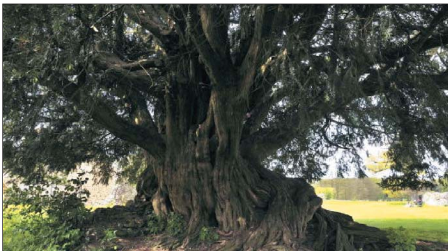
4. kép. Taxus baccata több évszázados egyede Angliában

Olykor a kolostorkert közepére is tiszafát ültettek. Példa erre az ír Muckross Apátság fennmaradt alaprajza. Ebben látható a „yew tree” felirat, amely a Taxus angol megnevezése. (5. kép). A Majna melletti Frankfurtban, a sценkenbergi szerzetesrend kertjében is áll egy hatalmas példány, melynek kerülete mellmagasságban mérve 220 cm – adták hírül a 19. század végén. De falkak főterein is találkozunk vele, ahol a tanácskozásokat tartották, és a település fontos ügyeiben döntéseket hoztak.