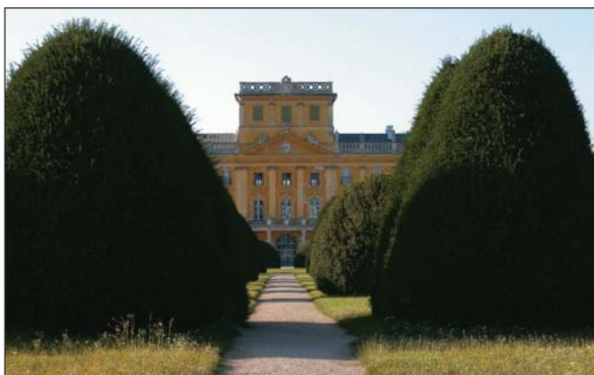
6. kép. Eszterháza barokk kertjének nyírt tiszafái

A tiszafa kertészeti felhasználásakor figyelembe kell vennünk, hogy gyermekjátszóterek, iskolák, óvodák kertjeiben kerülendő az ültetése. Parkokban azonban szép díszítőelem, fényesöld lombja mellett a piros magköpenyű termés is dekoratív. A terebélyes növekedésű alapfaj mellett az oszlopos 'Fastigiata' az aranylő levelű és a sárgatarka lombú 'Aurea' változatok a leggyakrabban ültetettek. Az 'Adpressa Aurea' néhány méter magas cserje, hajtásai aransárgák. A 'Dovastonia' magas bokor, értékes fajta. Megjelenése rendkívül szép, csüngő hajtásvégei különös megjelenést kölcsönöznek a növénynek. A 'Repandens' lassan növevő, alacsony, elterülő fajta, talajtakarónak kiváló, de zöldtetők beültetésére is alkalmazható. A 'Standishii' Angliából származó, a század eleje óta ismert, lassú növekedésű, aransárga hajtású, szélesebb, oszlopos növény.