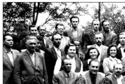
Néhányan az Észak-Mátrából (1955)

Az itt bemutatott fotó az Észak-Mátrai Állami Erdőgazdaság személyzetének egy csoportját mutatja be: