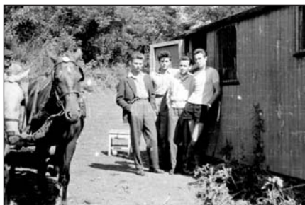
Ivád, Szénégető (1960)