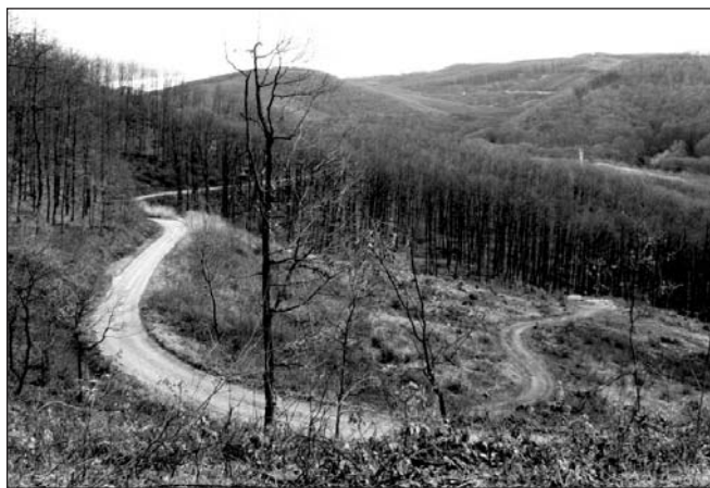
A „hadi út”

A hatvanas években erdészlakások sokasága épül, akkor még a felsőbb elvárásoknak megfelelően títustervek alapján, jellemzően a falvak szélein, az erdőbe vezető utak mellett, néhány még bent az erdőterületen (arlói iroda és lakások, Kissikátor, Farkaslyuk, Center, Borsodnádásd, Dobronya; a mátrai részen Erdőkövesd, Mátravák-Nyírmed, Váraszó, Cered, Zabar, Szentdomonkos, Mátraballa).