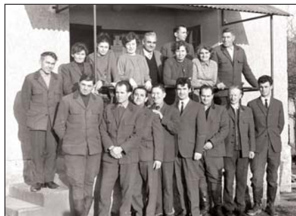
Az arlói csapat 1970-ben.

Schmotzer egy év után Puskás Pálnak adja át a fahasználatot, tőle származik a következő fotó, amely az Arlói Erdészet irodaépületénél készült 1970-ben.