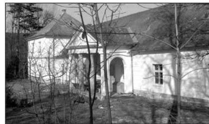
Az egercsehi Beniczky-kastély