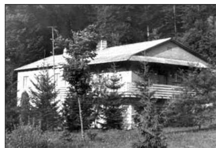
Dobronyai (Ivánkai) munkásszállás