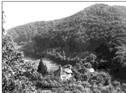
Az Iváncái „Tornyos Ház” (1955)

iváncái „Tornyos Házban”, és a cég Arlói Erdőgazdasága címen szerepelt. A csodálatosan szép környezetet, közepesen az iváncái épülettel, mint egy ékszerdobozzal, a következő fotón mutatom be: