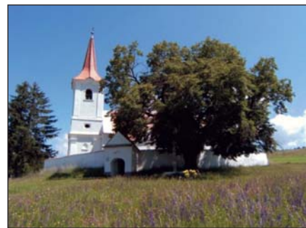
Csíkszentlélek 500 éves hársfája, mely elnyerte a 2010-es Év Fája nevű díjat. A egybáz „Historia Domusa” szerint „alatta ülték a falu törvényét”

Messzire (és félre) vezetne az európai fakultuszokat nyomon követni a keltáktól napjainkig. Maradjunk magyar, jórészt székely területen. Nálunk Mikes Kelemennek tölgyfája, Körösi Csoma Sándornak diófája, Petőfinek körtefája, az enyedi hős diákoknak fűzfája van... És ami a legkülönösebb, hogy az ezoterikus körökben oly nagy hír-