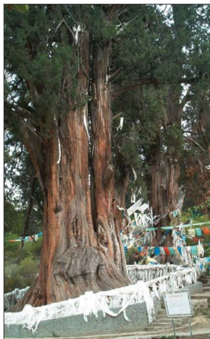
Bön zarándokhely szent fái imázaszlókkal és kérelmi, fogadalmi szalagokkal

Ezekből kiindulva megérthetjük, hogy milyen hitvilág rítusának elemét őriztük meg annak ellenére, hogy az eredeti összességében feledésbe merült. Empirikus módon rájött arra az alapelvre, melynek mentén a modern antropológia és kultúrtörténet holisztikus látásban hiteles rekonstrukciókat, értelmezéseket képes létrehozni.