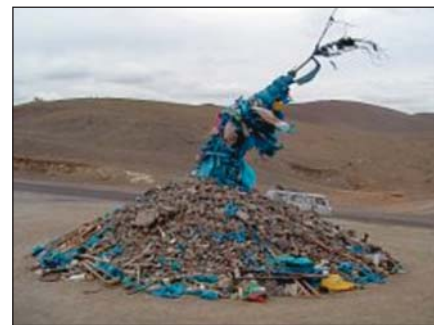
Mongóliai „óvó”, imádságok, kérések helye, középen a „világfával”

holt fát, melyet szalagokkal, szélzászlókkal díszítettek, leszakított „feláldozott” ruhacsíkokkal „szerelték fel” és amelyek Mongóliától Tibetig és Törökországig mindenütt ismertek.