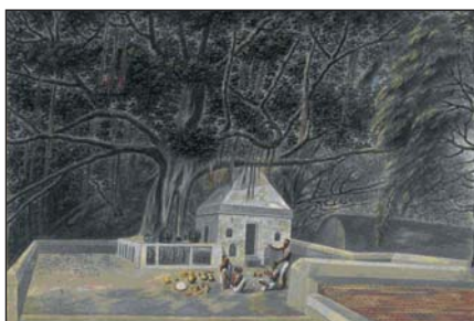
Bodbi szent fájának temploma a 7. századból, melyet Asóka király 3. században épített templomának eredeti mintájára emeltek. 1810-es rajz

Az „imafája” forma különös párhuzamot mutat az „istenfája” kifejezésünkkel. A birtokosi viszonyt kifejező alak mindkét esetben úgy nyomatékosítja a hovatarozást, hogy kizárja az azonosítást. Tehát az „imafájának” nem funkciója, hogy az imát (devotio-t) gerjessze, kiváltsa, mint ahogy az „istenfája” sem istenábrázolat vagy isteni tulajdonsággal felruházott élő vagy holt fa. Ő maga nem isten, hanem az isteni szférával való találkozás terének egyik meghatározó kelléke.