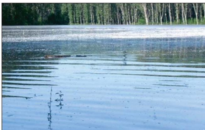
2009 őszi első kivitelű szürke nyáras, 720 cm-es vízállásnál (május vége)