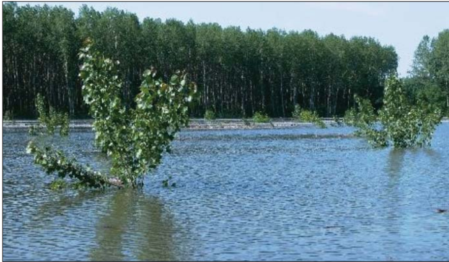
2. éves Többéves feketenyár-erdősítés, 720cm-es vízállásnál (május vége)