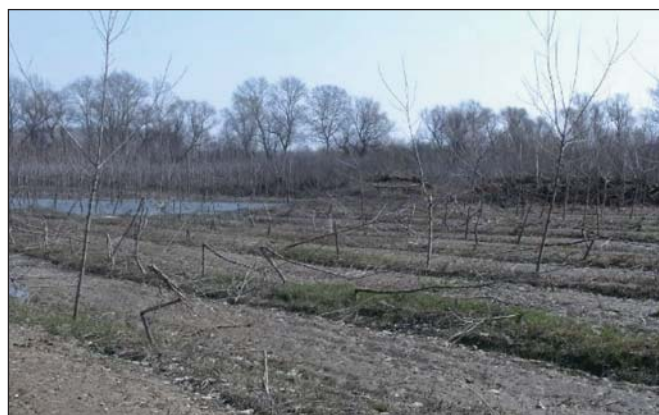
Többéves nemesnyár-erdősítés (március közepe)