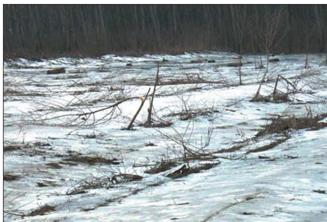
Ami a hároméves fekete nyárasból maradt és a jégtakaró (február vége)

Az elöntések közötti rövid időszakokban, felázott talajon, folyamatos esőzések mellett, nehéz körülmények között elvégzett tavaszi munkánkat a nyári, májusi árvíz nagyrészt tönkretette. A törre vágott, visszataposott csemetékre rámelegedett a víz, mely további