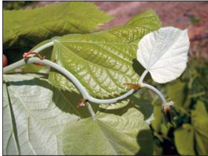
Fiatal ezüst hárs hajtás

Az ezüst hárs fiatalon árnyéktűrő, azonban idős korára fényigényessé válik. Bőséges lombjával egyrészt termőhelyét jól árnyékolja, másrészt talaját javítja. Társulásképeségének, fiatalkori növekedésének és jó szaporodóképességének köszönhetően fiatal korban versenyképes a bükkal szemben, azonban idős korára egyedszáma jelentősen csökken, állományaiból visszaszorul. A