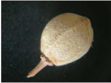
Az ezüst hárs makkocskája