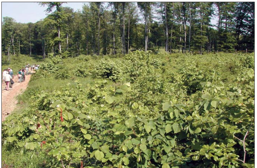
Természetes ezüst hárs újulat

Fiatal, elegyes állományaiban az ezüst hárs veszélyezteteti a főfafaj(ok) létét, ezzel szemben könnyen felújítható és nevelhető. Határ-termőhelyeken, ahol a főfafajok (tölgy, bükk) nehezen újíthatók és nevelhetők az ezüst hársat előtérbe kell(ene) helyezni. JABLÁNCZY SÁNDOR az ezüst hársat javasolja a kocsányos és kocsánytalan tölgy állományok elegyfajájának meleg, száraz termőhelyeken, valamint azokban az erdei- és feketefenyvesekben, ahol a lombozat talajjavító hatása fontos szempont.