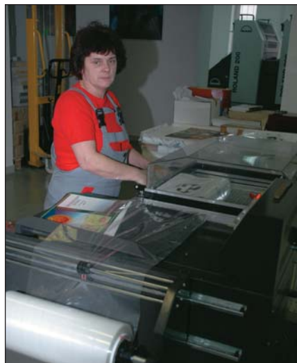
Dikter S. Judit csomagol

a lap, vagyis a kolléga regenerálja azokat a PDF-fájlokat, amiket a tördelő kijavítva átküldött. Utána egy CTP-berendezésre kerülnek ezek a kilőtt állományok, vagyis ezeket az elektronikus adatokat offsetlemezre világítja.