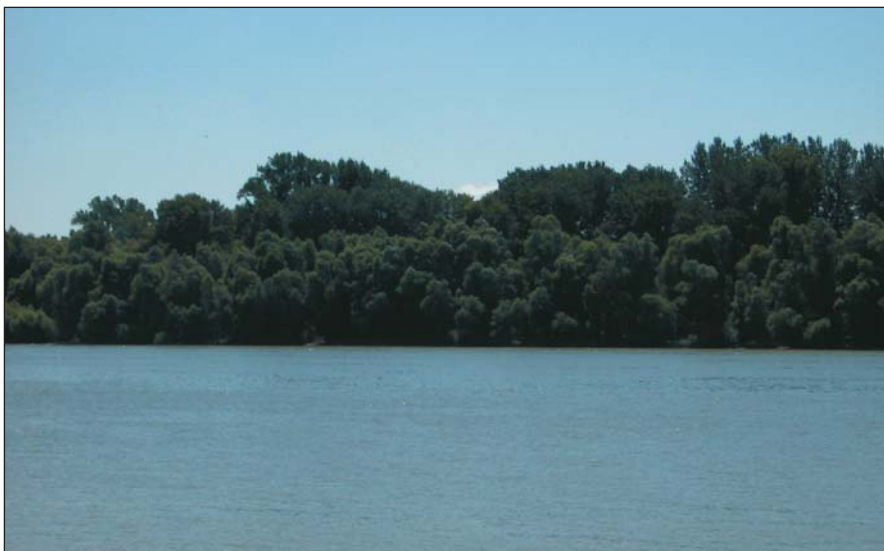
2. kép. A törékeny fűz egyik tipikus előfordulási helye a folyók partja

A törékeny fűz az üde, mély, laza, savanyú, gyengén savanyú – egyes vélemények szerint lúgos – öntéstalajokon tenyészik. Folyók és patakok mentén a rendszeresen elöntött területeken található meg. Ezek a részeken a víz ismétlődően rak le nagy szervesanyag-tartalmú, különböző szemcseösszetételű hordalékot. Ennek megfelelően a talajfejlődés gátolt, nem alakulhat ki humuszos szint, ezeket a talajokat nevezzük nyers öntéstalajoknak. Termőképességüket, így a törékeny fűznek való alkalmasságukat alapvetően a talajvíz közelsége, a talaj egyes rétegeinek szemcseösszetétele és mésztartalma határozza meg. Míg a Duna mentén nagy mésztar-