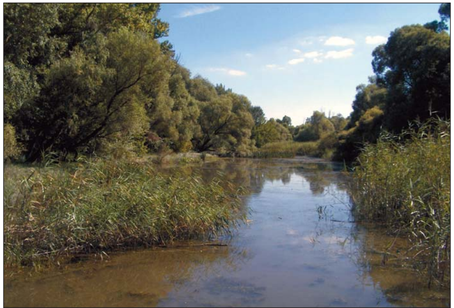
3. kép. A szabályozatlan mellékágak kedveztek a törékeny fűz előfordulásának

Az utóbbi évszázad(ok) folyószabályozási munkái, a kavicskitermelés, valamint a folyókon épített erőművek hatására nagy folyóink (különösen a Duna) sok helyen „bevágódnak” a medrükbe, ami azt jelenti, hogy a vízszint (különösen a kis vízszint) folyamatosan süllyed. Ennek hatására a folyó partján található erdőtülszűkítések vízellátottsága romlik, ami az erősen vízigényes fehér fűzekből és törékeny fűzekből álló vízparti sáv eltűnését eredményezheti. Gyakran találkozhatunk olyan képpel, hogy a folyó közvetlen közelében álló állományok vízhiány miatt száradnak, mivel gyökerük már az év nagy részé-