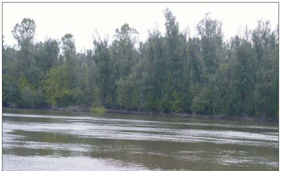
5. kép. Csúcsszáradt fűzesek a Duna mentén

Az öntés- és lejtőhordalék-talajok legtöbb esetben jó tápanyag-ellátottságúak is, hiszen az üledéklerakódás során nemcsak ásványi, hanem szerves