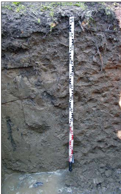
4. kép. Humuszos öntéstalaj a Duna mentén

Összefoglalva megállapíthatjuk, hogy a törékeny fűz a folyó- és patakpartok fája. Széles termőhelyi toleranciája miatt hazánkban a legtöbb vízfolyás mentén találkozhatunk vele. A termőhelyek megváltozása és csekély gazdasági jelentősége miatt az utóbbi időben előfordulása csökkent.