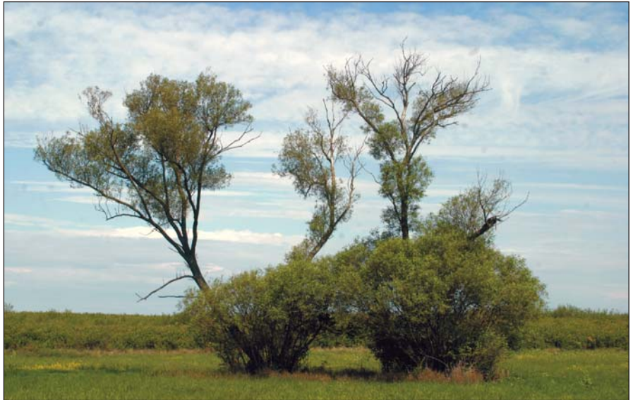
1. kép. Törékeny fűz

A törékeny fűz elterjedési területe alap-