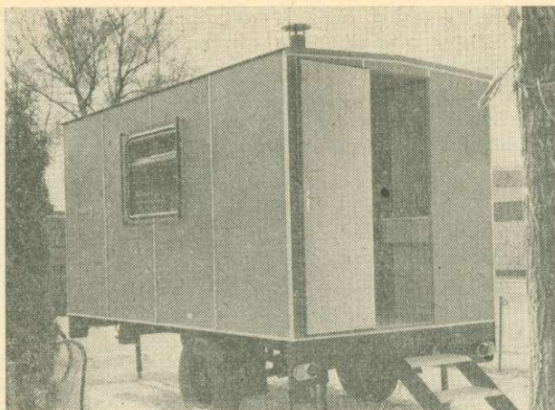
3. ábra. EM—8 erdei munkásmelegedő

szerű, kulturált szállítás követelményeit, másrészt munkahelyi melegedőként megfelel az alapvető szociális normákkal szemben támasztott követelményeknek (fűthető, világítható, étkezésre, tisztálkodásra alkalmas). 1982-ben pl. 114 db, a személyszállító gépjárműpark 12 0 / 0 -a volt a kettős hasznosítású, kulturált szállítás és a munkahelyi melegedő funkcióját is betöltő kiskunsági brigád-kocsi. Ebből az UAZ 452 alvázra szerelt, esztétikailag is tetszetős gépjárműből mintegy 350—400 db-ra lenne szükség.