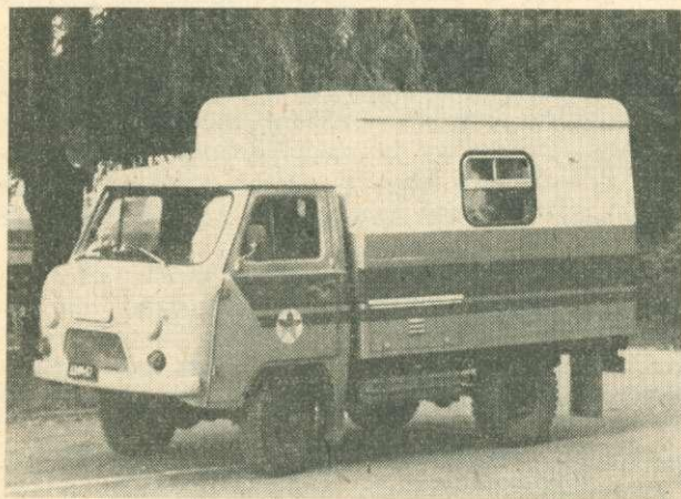
4. ábra. Kiskunsági brigád-kocsi