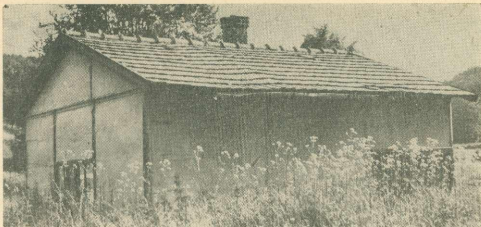
1. ábra. Munkásbarakk a Bükk-fennsíkon

lépésnek minősültek. „Ezekkel a barakkokkal erdei dolgozóink végre emberhez méltó elhelyezéshez jutottak. Az évszázados múltra visszatekintő primitív kaliba elhelyezés hamarosan már csak a múlt rossz emlékei közé fog tartozni.” (Horváth, 1950.)