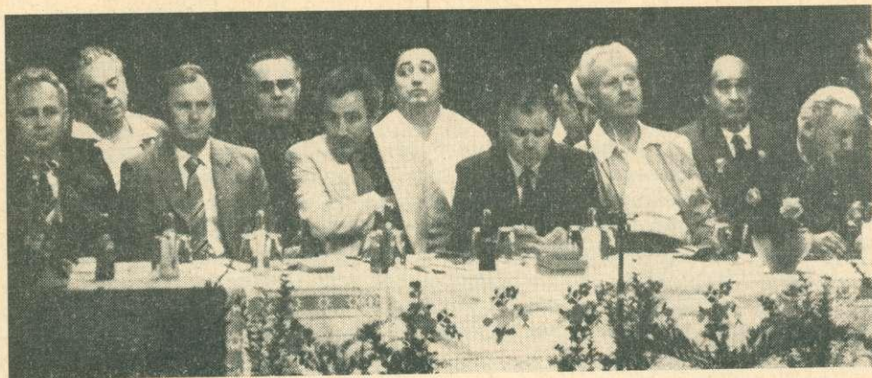
A termelészövetkezeti nap elnöksége