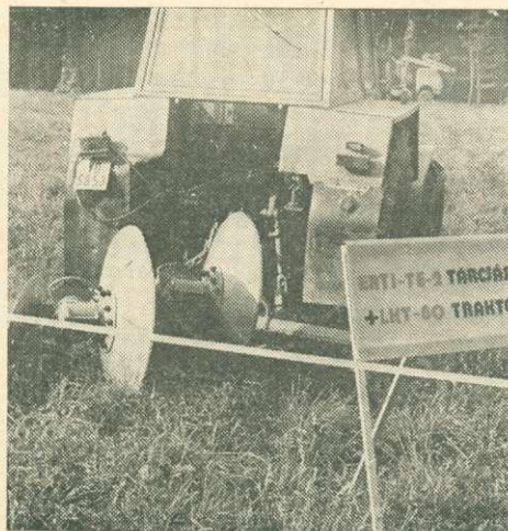
ERTI tárcsás eke