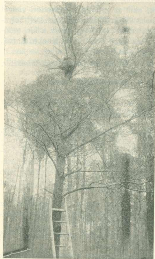
35. kép. Erdei fenyő Bolle-féle fertőző anyaggal.