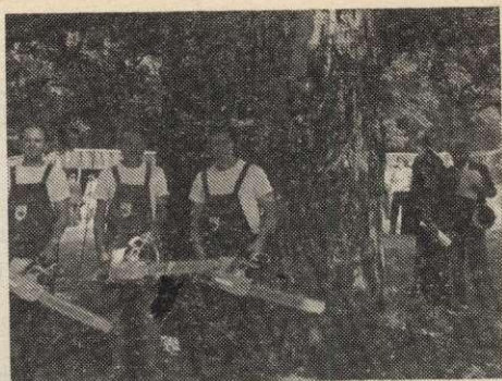
A budavidékiek csapata

A gallyazás során a ledöntött fát kellett hossztolásra, illetve hosszúfás közéletésre alkalmassá felkészíteni a versenyzőknek.