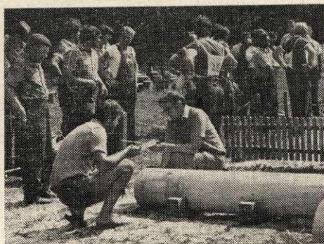
A lánckimélő darabolás