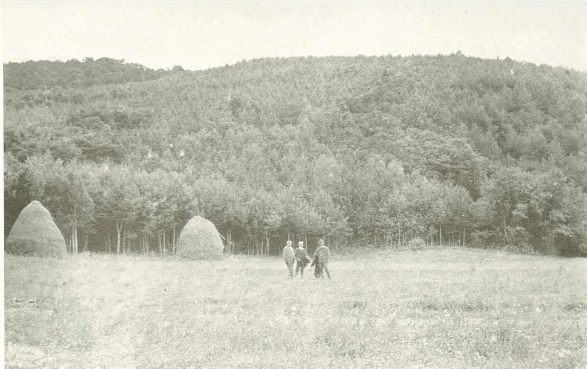
Erdeifenyővel és akácczal erdősített egykori kopár Lónyabánya közelében. (Nógrád m. Zichy-senioratus divényi uradalma)