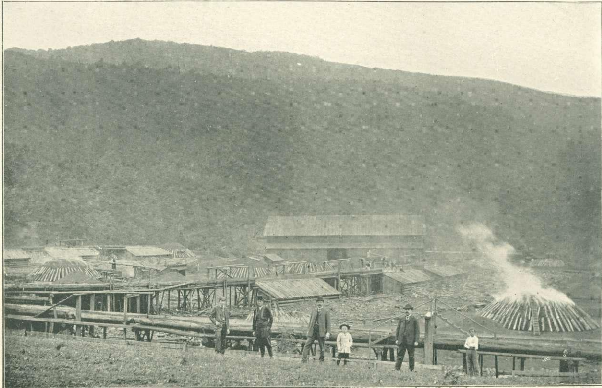
25. kép. A krusëicai központi szénító-telep (Bosznia).