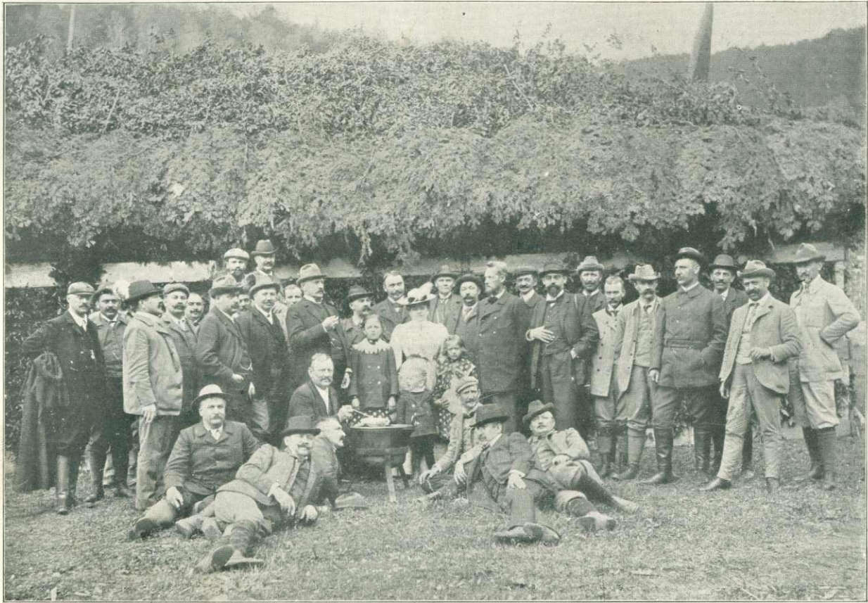
24. kép. Az Országos Erdészeti Egyesületnek Boszniába kirándult tagjai és vezetőik Blatnicán.