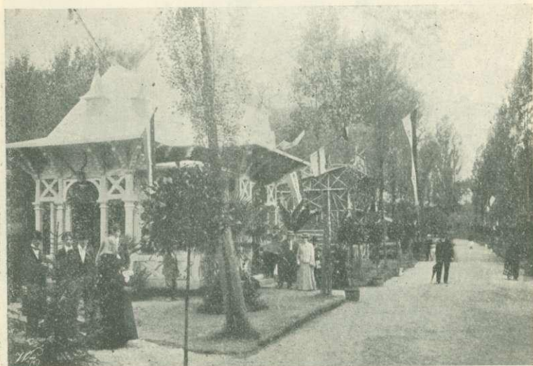
29. ábra. A lovag Hahn-féle uradalom csarnoka a zsolnai kiállításon.

hivatott szakszerűséggel fejlesztette ez iparágat. A F. M. K. E. megbizásából a szélaknai ipartelepét Chvojnícára helyezte át, a hol jelenleg 24 munkást foglalkoztat. Iparcikkei u. m. állatok, hintalovak, talicskák, játékszerek és kocsik, lucz-, jegenyefenyő-, bükk- és hársfából készülnek s főleg a kocsik és talicskák tartósság és olcsóság tekintetében a hasonló külföldi iparcikkokkal a legélénkebb versenyt is kiállják. Miután Chvojnícán nincsen luczfenyő, ez az ipar valószínűleg élénkebb forgalmu fenyesvidékre fog átköltözni, a hol 200 munkás foglalkoztatására rendeztetnék