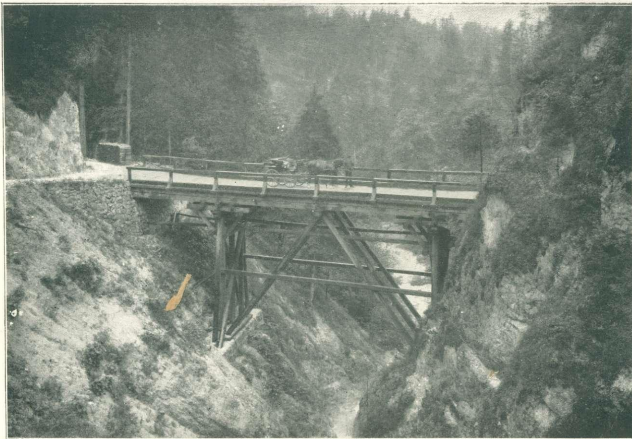
Erdei ut hiddal, a goiserni cs. k. erdőgondnokságban (Felső-Ausztria.)

»A külföld erdőgazdasági beruházásai« című cikkhez.