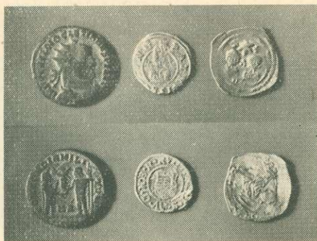
2. ábra: Diocletianus római császár érmétől — Hunyadi Mátyás érméig.

stb.) mesterséges védővonal keletkezése időszámításunk kezdetével esik egybe. Az 1950—1965. évek között az árok melletti véghasználati erdők kitermelésekor szarmata-jazig égetett agyagedények, Diocletianus római császár (284—305) érméjétől Hunyadi Mátyás érméjéig (1460) számos lelet került elő.