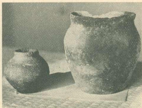
1. ábra. Szarmata — jazig égetett agyagedények

A legállandósultabb régészeti emlék az erdőn keresztül húzódó „Csörsz árka”. Az 5 km hosszú árok-vonulat több helyen derékszögben megtörik. Helyenként négy méter mélységet és kilenc méter szélességet is elér. Az árok melletti töltés mindig az árok déli részén van. A „Csörsz árka” (avar árok, ördög árok