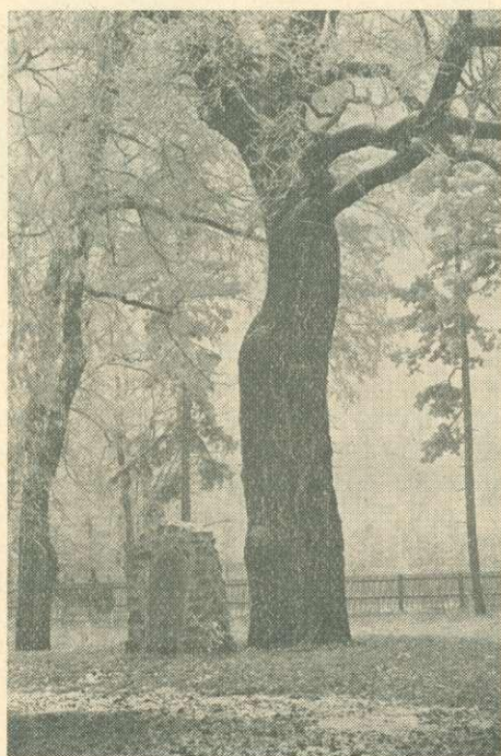
4—5. ábra. Az első világháborúban elesett erdészek gödöllői emléktáblája, új helyén