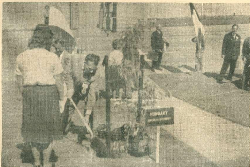
Dr. Balassa Gyula miniszterhelyettes elvtárs elülteti Magyarországnak emlékfáját

ket, azt ajánlja, hogy a gazdaságilag fejletlen államok küldjenek embereket a magas színvonalú szakoktatási intézményekkel rendelkező államokba tanulni. Különösen aláhúzták annak jelentőségét, hogy az erdészeti szakembereknek elsősorban a közgazdasági tudásukat kell továbbfejleszteni. Abban nincsen két-ség, hogy az erdészek biológiai és műszaki vonalon képesek lépést tartani a fejlődéssel és meg tudják oldani a felmerülő problémákat, de az országoknak olyan szakértőkre is szükségük van, akik fel tudják mérni azokat a közgazdasági tényezőket, amelyek a fafogyasztást, a szükségletek alakulását befolyásolják. Ezért a Kongresszus javasolja, hogy a különféle, erre illetékes nemzetközi szervezetek tegyenek lépéseket ilyen képzettségű szakemberek nevelésére.