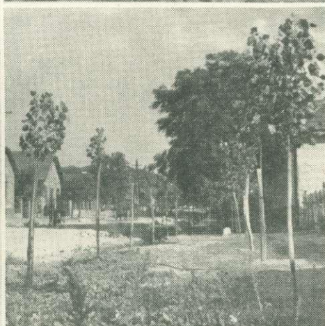
Vízmosás kötés Felsőtárkányban — Mindketten hatévesek — Kopár talaj előkészítése az akali legelőn — A falusi utcán is tért hódít a nyár