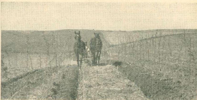
1. sz. kép. Egyéves akác-ültetés szántása ősszel.