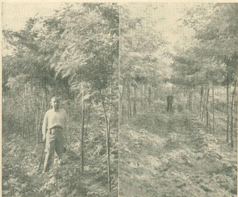
2. sz. kép. Kétéves akácos. (Telepítése: 1937 III., a felvétel 1939. május hónapban készült.)