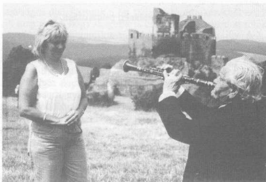
Az a szép, az a szép...