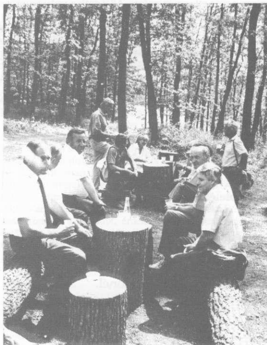
Jólesik a jéghideg sör a cseres árnyékában