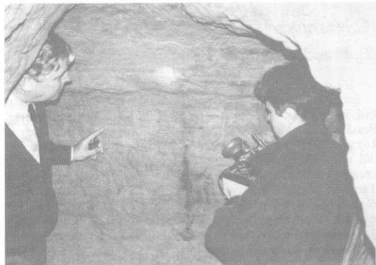
A tsitári alagút feltáró szakasza

ge Drégely ellenben napokig sem tarthatta magát. Nem védői, hanem falai voltak gyöngék s omlottak össze a török ágyúk első lövéseire. A nagy torony mindjárt bedől s többeket maga alá temetett, de a rohamot Szondy vitézül visszaverte, mire Ali a nagy-oroszai pap útján szólította föl, hogy eleget tevén a fegyverbecsületnek, szabad elvonulás mellett adja át az összelőtt erődot. Szondy azonban a gondjaira bízott vár romjai alá akart temetkezni. Foglyait és két gyermek-apródját, Libárdyt és Sebestyént a török táborba küldé, s arra kérte a pasát, hogy tisztességre tanítsa, vitézekké nevelje őket, magát pedig, ha elesik, temettesse el tisztességesen. Megtevéen végintézkedéseit, megmaradt társaival elszántan várta a török új rohamát s vitézül harcolva esett el. A pasa teljesíté a hős utolsó kívánságát, tisztességesen eltemette és sírjára iratos kopját tétetett. A kötelességteljesítés és hazafiasság nemes példájaként él azóta Szondy a magyarság emlékezetében. Már kortársa, Tinódi megénekelte s daliás alakja soha sem szűnt meg legjobbjainkat dalra lelkesíteni. A nemzet azon rétegeiből származott, melyek akkor kívül álltak az alkotmány sánczain. De életével és halálával tanúságot tett arról, hogy hazaszeretet és kötelességérzet nincs rendi kiváltságokhoz kötve, s élni-halni minden igaz ember tud szülőföldjeért.