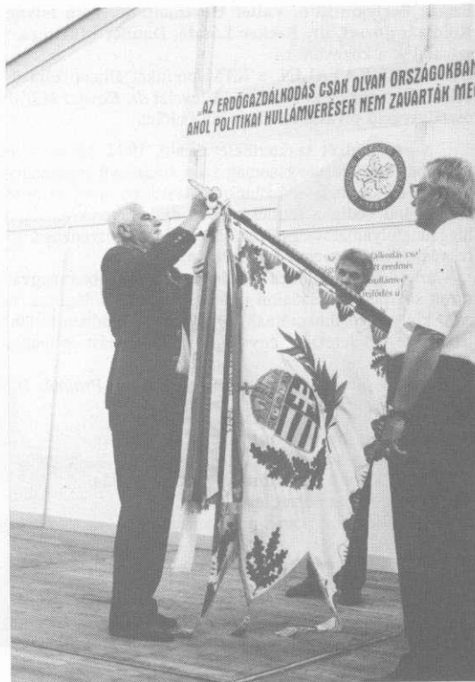
Szalagot köt az Ipolyerdő Rt.

1916-ban a Nógrád megyei Múzeum igazgatójának választották meg. 1925-ben, amikor a Múzeum felújítása ha-