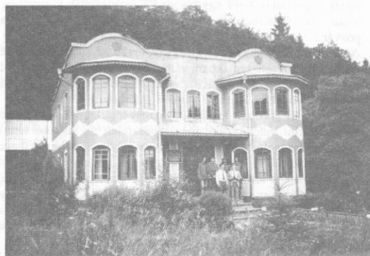
A budemjenci erdőgazdaság