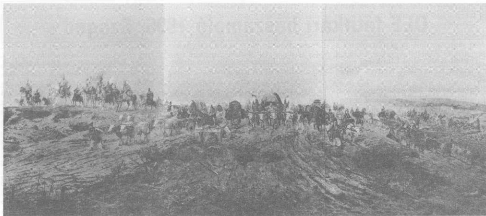
Részletek a Feszty Kórképből

hány tévessze el a mozdulatot, legyen hosszabb a ló féktávolsága a megkövetelnél, máris felbomlik a hadrend, egymást legázolja keverednek össze a támadó oszlopok, a fölbukott lovak és lovasaik az ellenség könnyű prédájává válnak. E három felsorolt adat meggyőzhet bennünket, hogy a katonai kíséret mai szóval élve professzionista, hivatásos katonákból állott, soraik között nem lehettek „utcáról bejött fegyveresek”, hiszen minden egyes egyéni és katonai egységbe fogott mozdulatot jó előre be kellett gyakorolniuk. Így azután bővebb lélekszámban kell gondolkoznunk, mint a felvetett második lehetőség feltételezte.