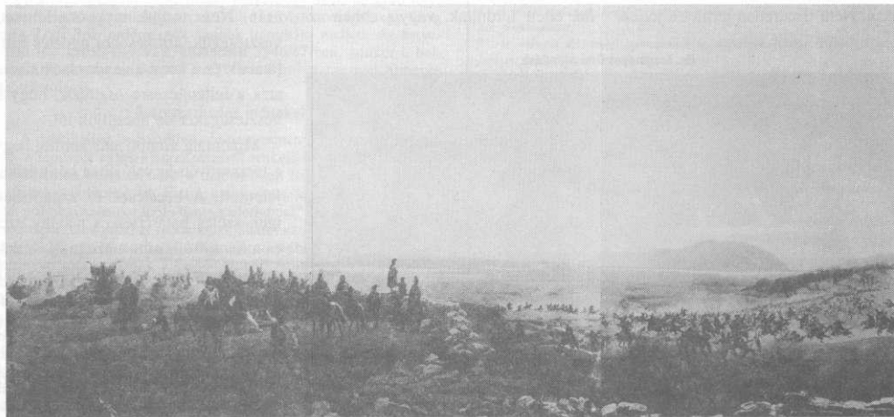
Részletek a Feszty Körképéből

Végezetül a híres szent Galleni kalandot kell említenem, ahol a szemtanú leírja, hogy a mulató magyarok dalolásuk és hadi játékaik közepette kürtészó hallatára felhagytak a mulatozással és azonnal „a férfiak gyorsan kifelé sietnek, ki hogy tud, és ahogy szoktatva voltak, előbb sem mint hinné az ember harcra készen csatasorba álltak.” Amint szoktatva voltak. Itt egyértelműen begyakorlott hadmozdulatokról van szó, s itt kell visszatérnünk előadásunk furcsának tűnő címére. Akár a színlelt támadás, akár az ellenfél hadrendje előtt keresztben mozgó alakulatok, a szorosan egymás mellett vágató és nyilázó több ezer lovas, csak akkor tudott sikeresen győzelemre vinni egy hadműveletet, ha kürtészóra és más jelekre jól begyakorolt, éveken át besulykolt hadmozdulatokat tudtak végrehajtani. Gondoljuk el, frontálisan vágató ezer lovas, esetleg több lépcsőben, egyszerre fordul meg. Csak né-