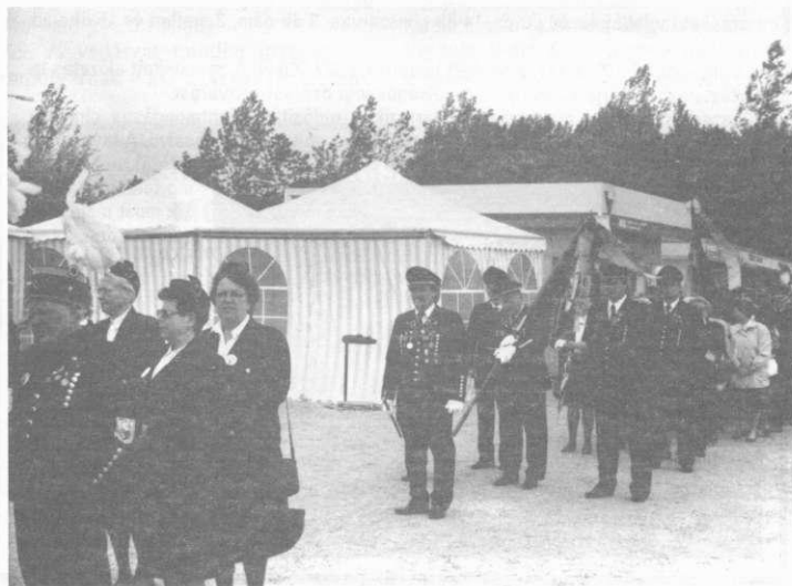
A bevonuló egyenruhás hölgyek és urak

Az első világháború utáni Párizs környéki békekben megvont magyarországi határon belül jelentős ércbánya alig maradt. A két világháború között a szénbányászat műszaki színvonalja közepesen fejlett volt.