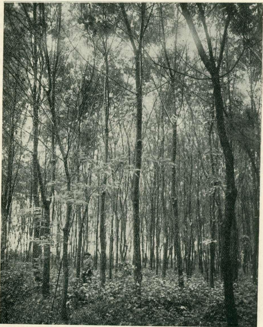
2. kép. Ráczekevi uradalom : 16 éves kőrisfarészlet.

Az így nevelt tölgy-, kőris-, feketedió- és ákáczcsoportokat tüntetik fel az itt bemutatott fényképfelvételek. (1—4. ábra.)