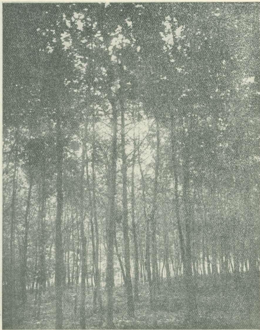
1. kép. Ráczkevei uradalom: 15 éves tölgyfarészlet.

A fentartandó műfacsoportok már a telepítés alkalmával szemeltetnek ki és különös figyelemben és ápolásban részesülnek.