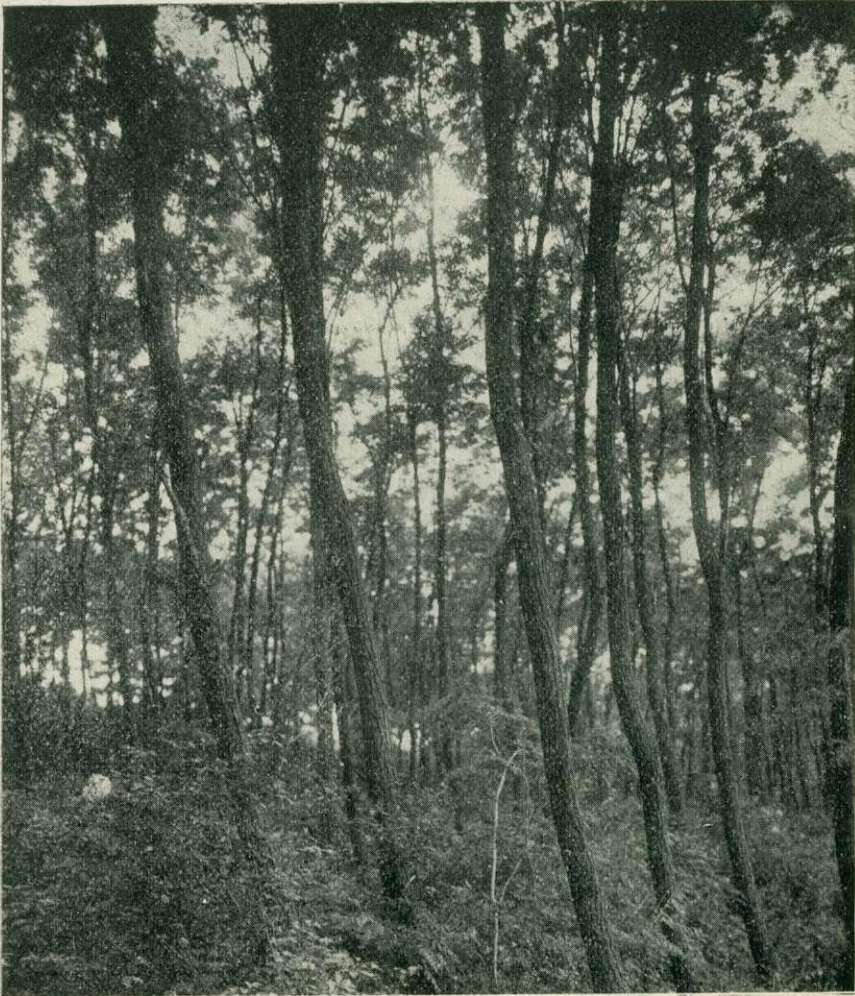
3. kép. Ráczekevei uradalom: 18 éves ákáczos.

eredményeket érnek el. Az eredmények teljes mértékben igazolják a jelenlegi erdőgondnok, Praxa János által felállított irányelveket, melyek az alábbi pontokba vannak foglalva;