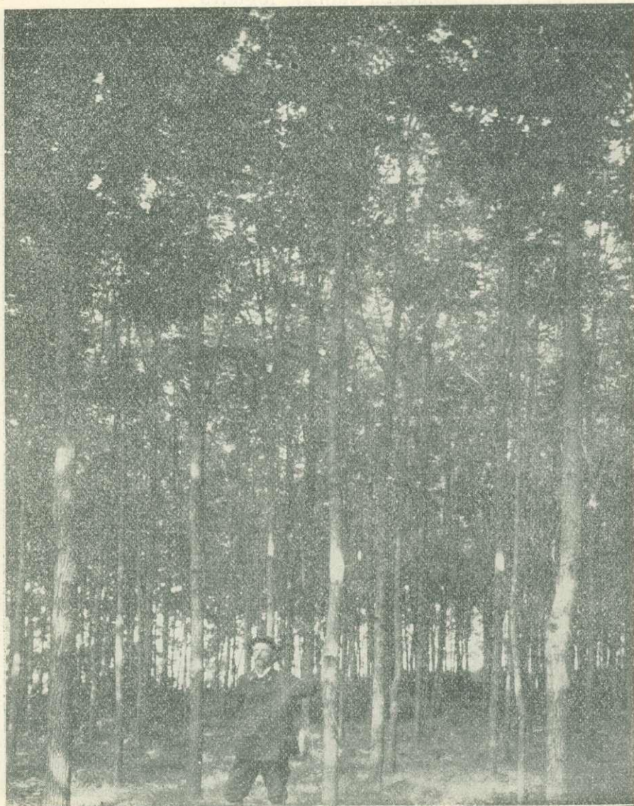
4. kép. Ráczevei uradalom : 15 éves feketediófárészlet.

2. Minden ültetési munkálatot már ősszel 40 centiméter mélységig menő talajforgatásnak kell megelőznie. A talajt ásóval