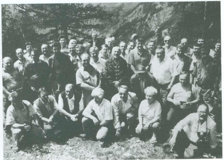
A résztvevők csoportja 1611 méteren