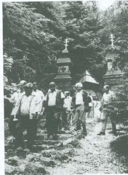
Orosz hadifoglyok építette kápolna

lovag az osztrák császár és a magyar király közötti harcokban az utóbbit támogatta. Amikor a császár lefejeztette barátját, Erasmus vitába keveredett a császár rokonával, és megölte azt. A barlangi várba menekült. A lovag császári kereskedő karavánokat fosztogatott 1484-ben. Egy áruló szolga