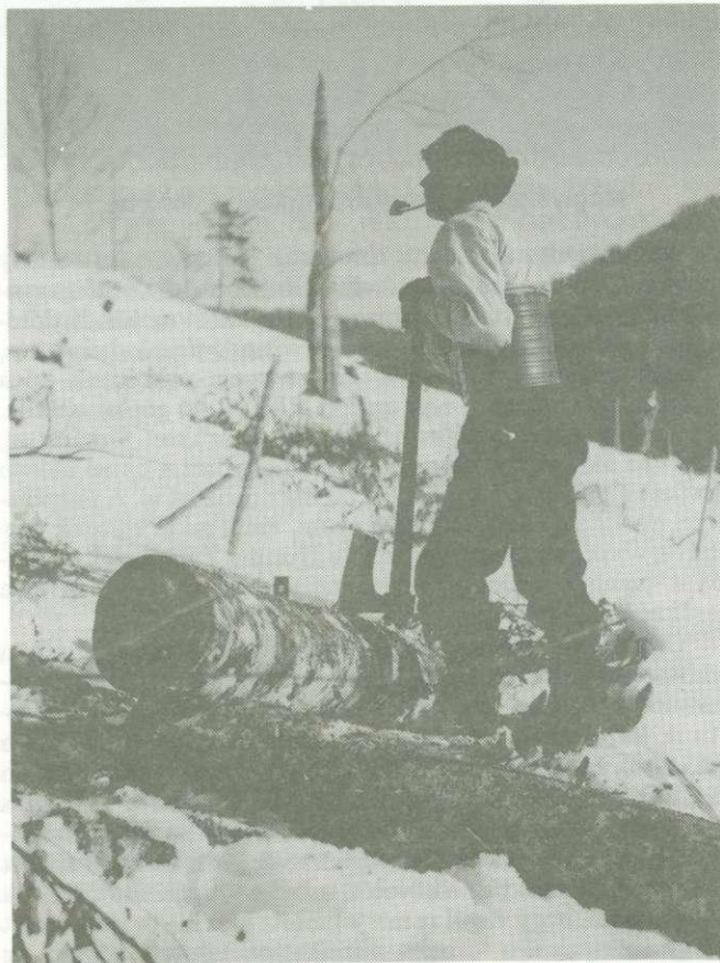
Talpafaragó a keleti Kárpátokban (:Jérôme)

Ez az elszámolási rend kielégítően működött. A fa az erdőről csak ellenőrzött úton, vízen, tutajban, őrzött völgykijáratokon át juthatott ki, a döntést, felkészítést, közelítést darabszám szerint fizettük. A baj akkor kezdődött, amikor sorra érkeztek az ország belsejéből a kicsinyes neveltetésű számvevők, akiknek a magas hegységi viszonyokról fogalmuk sem volt. A legnagyobb botránnyó a „vetet” volt. Így neveztük azt a farakást, ami a csúszatók végénél képződött a csúsztatott anyagból. A csúszatók kellő kihasználása végett a mellékvölgyekben a vágások évről évre egymás mellett sorra következtek. A fához a csúsztatás alatt hozzáférni nem lehetett, mert gyorsvonati sebességgel érkeztek a 20-25 m hosszú szálak. Ez szaporodott fel a vetetben gyakran több ezer m 3 -esre, mire a csúsztatás befejeződött, a vetetre gyakran leesett a hó, és ha a széthúzatás télen nem ment kellő ütemben és tavasszal a tutajozásnak meg kellett indulnia, a vetetben bizony jócskán maradt fa, amit felmérni megint