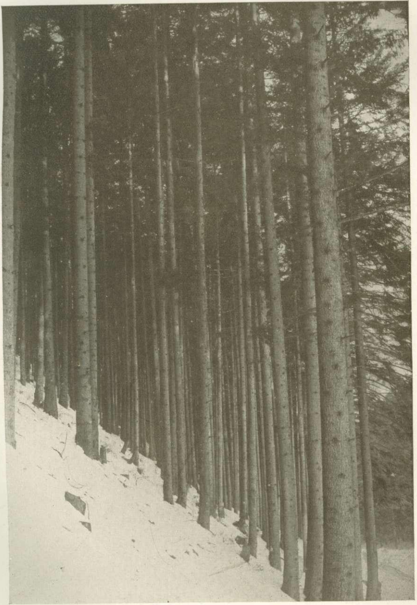
Részlet az óhegyi m. kir. erdőgazdálkodás Medvédülő (Medvedza) nevű jegenyefenyveséből, amelyet Decret József idejében ujtottak föl.