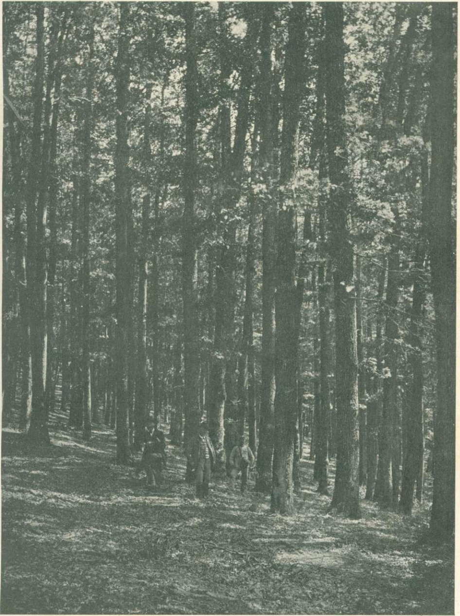
1. kép. Öreg kocsántalan tölgyerdő Zsarnócza vidékén.

(Garamrévi m. kir. erdőgondnokság. — Bund K. felvétele.)