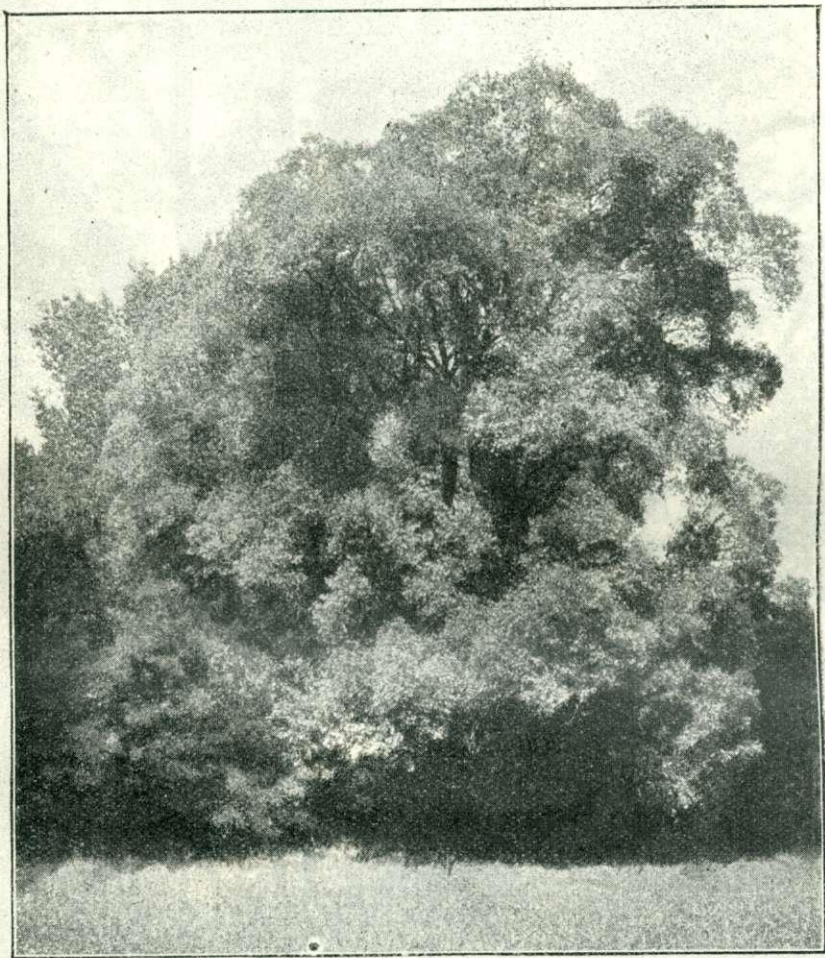
22. kép. A lellei nagy fűzfa. II.

Az állami erdőbirtok szaporodása. Az állam a közelmultban több birtok megvásárlásával növelte erdőterületét. A csorbai tónak és környékének megvásárlásán kívül, melyről már annak idején megemlékeztünk, éppen a Magas Tátra déli lejtőjén még több más birtokot is megvásárolt az állam, úgy hogy ezen összesen