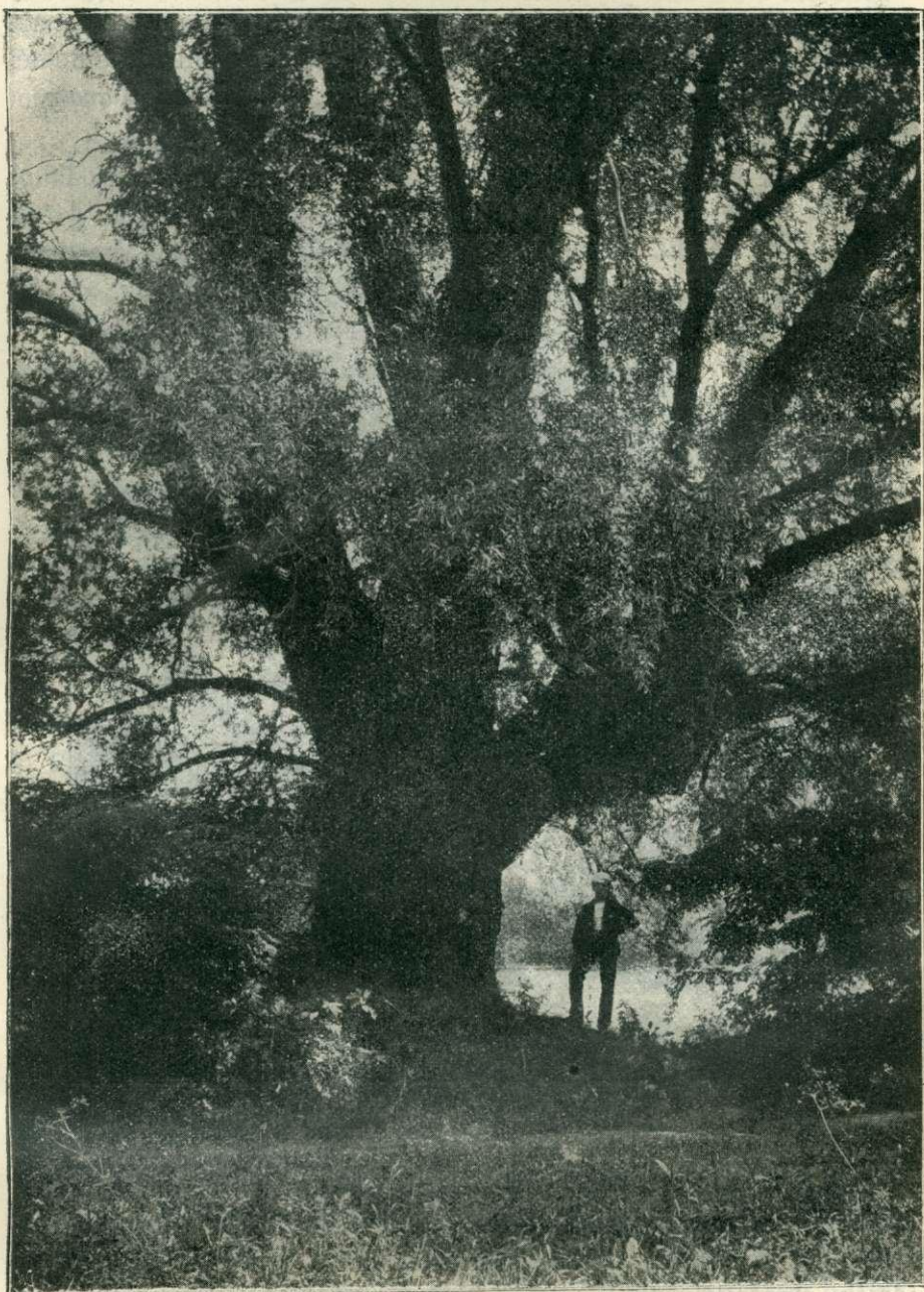
21. kép. A lellei nagy füzfa. I.