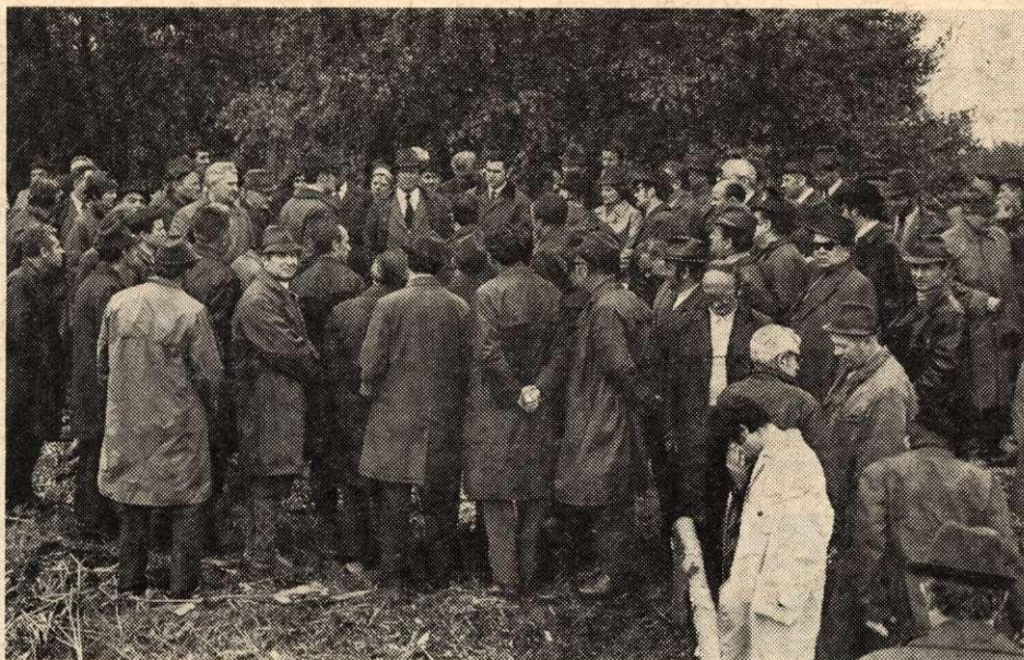
2. ábra. A tanulmányút résztvevői

rendeltesítésű csatornahálózat létesült 80 műtárggyal. Ezzel párhuzamosan az erdőgazdaság 1961-től 1971 végéig erőteljes erdőtelepítéseket végzett, majd a feltáró úthálózat kiépítését kezdte el, amelynek befejeztével a IV. ötéves terv-időszakban 50 km, mechanikailag stabilizált főfeltáró út és 6,7 km erdei vasút épül. Az Észak-Hansági erdőtelepítésekkel 4000 ha nemesnyárust létesítettek, míg az erősen kotus, tőzezes talajokon a lúp természetes növénytársulását képező fafajokkal erdősítve, 2000 ha-on mézgás éger és fűzzel elegyes nyárasokat, helyenként magaskőrís, kocsányos tölgyvel elegyes erdőket alakítottak ki. A nemesnyárasokban az olasznyár (I. 214) 50 0 / 0 , az óriásnyár 30 0 / 0 , a korainyár