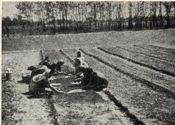
4. Gyomlálás a csemetekertben.

Enlèvement des mauvaises-herbes dans la pépinière.