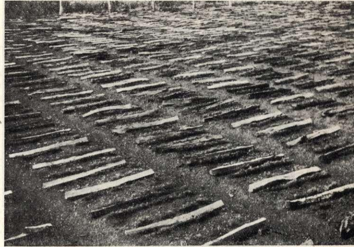
2. Hasábfák árnyalják a haraszi csemetekertben a vetések sorközeit.

Ezzel szemben egyre erőteljesebben bontakozott változatos formájában az erdőigazgatóság erdőművelési tevékenysége. Kétségtelen és igazságos megállapítás, hogy az erdőművelés fontosságát, szervezett, kézbe tartott irányítását az erdőigazgatóságokon ismerték fel és építették ki. Első látható jelei a tavaszi magvetések előírásaiban váltak felismerhetővé. Irányt mutattak erdőgondnokságainknak a vetési területek fafajok szerinti megosztására, többnyire kézbe vették a famagvak egységes beszerzését és legalább az erdőigazgatóságon belül biztosították az egységes fellépést a magkereskedők sokszor túlzott követeléseivel, minőségileg kifogásolható szállításaival szemben. Érvényt szereztek a magszállítmányok csirázási kikötéseinek és ezen keresztül javították a vetések várható eredményeit. Felépültek és üzembe helyezték az első magpergetőket, melyek közül a csákánydoroszlói áttörte a magánszektor addig egységes, tömegszállításra berendezkedett frontját, a peszéradaci mutatott tudatosan utat a tájváltozatok, különösképpen a homokon aklimatizált fenyőmagvak elkülönített, minőségileg is kifogástalan, márkázott pergetésére, szétkül-désére. A peszéradaci kezdeményezés további lépést is jelentett, a magpergető üzembhelye-