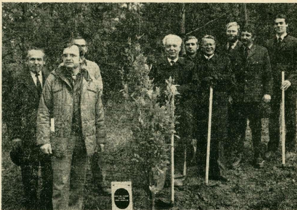
A FAO-bizottság magyar delegációja az általa ültetett emlékfával

Október 31-én a FAO Európai Erdészeti Bizottságának tanulmányútja keretében a visegrádi fűvészkertben állítottak emlékoszlopot. Az oszlopot Fleoras Rodas , a FAO vezérigazgatója leplezte le, s ezt faültetés követte. Ez az oszlop