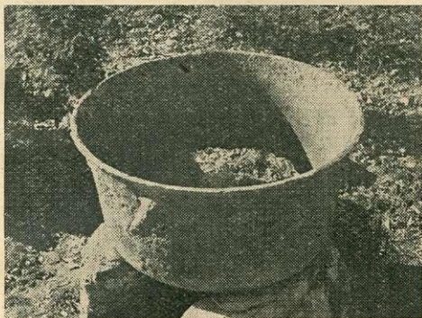
Hamuzsírforró üst az 1700-as évekből