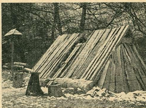
Fazsindelykészítők kunyhója (műhely és szállás) belső tűzrakóhellyel, szabad füstjárattal

valamint a faszenes boksa, a hozzájuk tartozó nyári, illetve téliesített kunyhó-típusokkal.