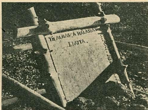
„Tilolmas a halászat ebatta! 1834.”

A szilvási vashámorban gyártott egyik feiratos tábla ma is meglevő emlékünk. Szövege: „Tilolmas a halászat ebatta!” 11. MAJ. 1834. CNK. Készítője Czakó Nagy Károly volt.