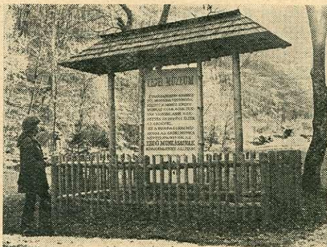
Az Erdei Múzeum bejárati táblája