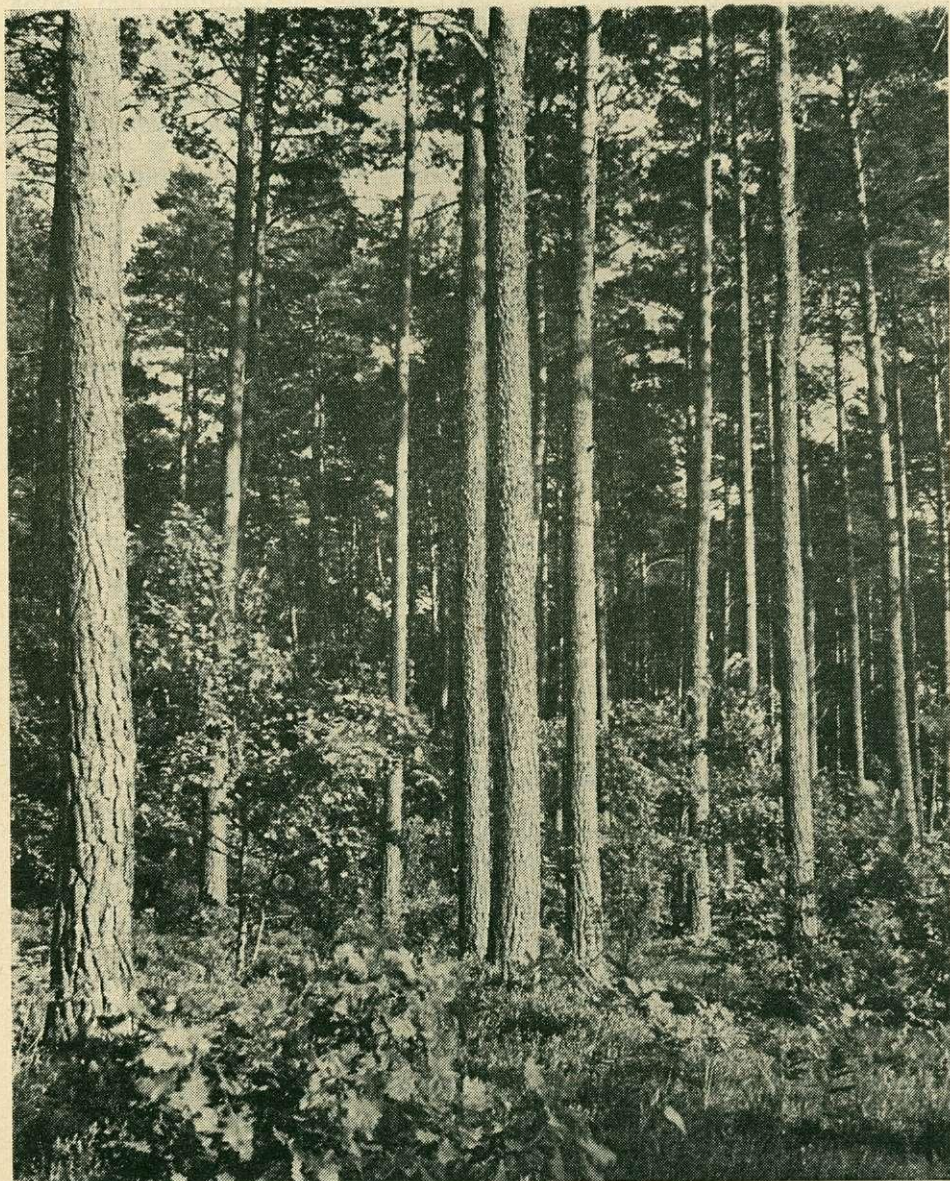
I. A lengyel erdők több mint 60 0 / 0 -át elegyetlen erdeifenyvesek alkotják.

A fa alapanyag legnagyobb részét a fűrészüzemek és a hozzájuk kapcsolódó vertikumok (láda-, parkettaüzem) dolgozzák fel. Ezek évente több mint 7,0 millió m 3 fűrészárut termelnek (1969-es adat), amelyet mint félkész terméket