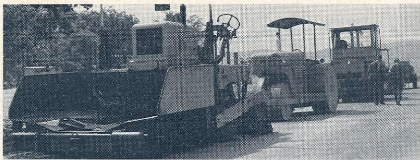
Az útépités korszerű géplánca

A vándorgyűlés résztvevőit a Dunakanyar hatalmas zivatarral és záporral is meglepte. Ez a vihar alaposan megtépázta a római és korai magyar emlékeket őrző Sibrik-domb tetejére telepített vacsorázó helyet is. A gondosan előkészített sátor-tetőt sok helyen felszaggatta, átázta a padokat és messzire repített sok kikészített tányért, nehézséget okozva a rendezőknek.