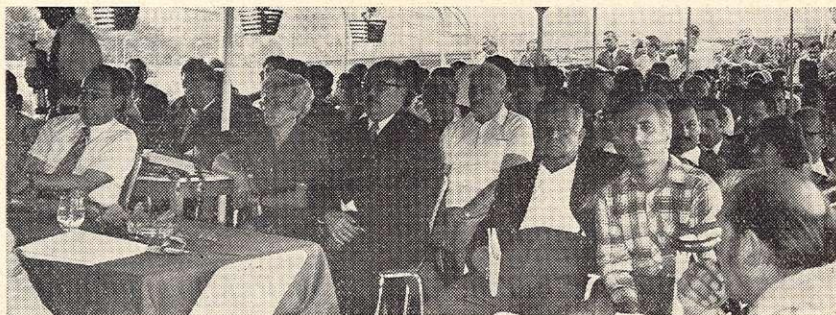
A küldött-közgyűlés résztvevői