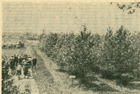
7. ábra. 42 balzsamosnyár-klón 4 \times 4 m-es hálózatban, ötéves korban; négy ismétléssel telepített populétum Dresden-Loschwitz-ben

9. Az ismeretek további elmélyítése, illetve a nagyszámú probléma alaposabb megtárgyalása érdekében hasznos lenne, ha a konferencia három munkacsoportjában felvetődött kérdéseket és a már eddig elért eredményeket a tárgykörrel foglalkozó szakemberek a konferencia után is állandóan napirenden tartanák.