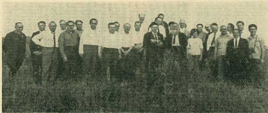
8. ábra. A külföldi szakemberek és a házigazdák egy része a Lipcse környéki bejáráson

Az erdőnkívüli fásítás problémájával foglalkozó első nemzetközi tudományos konferencián alkalmunk volt meggyőződni, hogy az erdőnkívüli fásítás a résztvevő 6 KGST országban, továbbá Jugoszláviában és az NSZK-ban egyformán nagy jelentőségű a mezőgazdasági termelés biztonsága, a hozamok fokozása, a talajvédelem, a népegészségügy, továbbá a faanyagtermelés tekintetében. A mintegy 45 szakember egységesen azt az álláspontot képviselte, hogy a fásítás védő feladatait és a faanyagtermelést egymással össze kell kapcsolni, az erdőnkívüli fásítást minden országban állampolitikai feladattá kell tenni, mert a fásítással a mező- és erdőgazdasági többtermelést, továbbá a természeti tartalékok mozgósítását és a tájvédelem fokozását érjük el. A fásítás területén a munka intenzívebbé tétele meggyorsítja a békés munka kibontakozását, a gazdasági és a kulturális fejlődést.