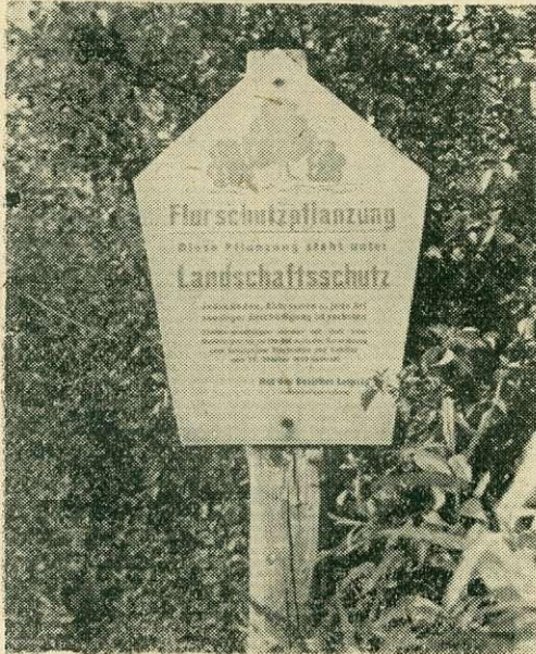
5. ábra. Az NDK-ban minden erdősáv végén ott áll a védelmi tábla. (A tábla felirata: Mezővédő fásítás. Ez a telepítés tájvédelem alatt áll. Mindenféle irtás, tüzelés és egyéb károsítás tilos. A tilalom megszegéséért a sövények és facsoportok védelméről szóló 1953. október 29-i rendelet értelmében elzárás vagy 150 márkáig terjedő pénzbüntetés jár. A lipcsei járás tanácsa. Tájtervezés)

8. Az erdőnkívüli fásítással és a tájvédelemmel kapcsolatos oktatást, kiképzést és felvilágosító propagandát a mező-, erdő- és vízgazdálkodásban, továbbá az építésügyi és közlekedés terén a legsürgősebb feladatok közé kell sorolni.