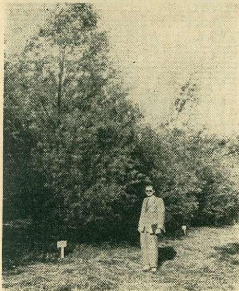
1. ábra. A graupai négyéves, 81 klónnal, 4 \times 4 m-es hálózatban négyszeres ismétléssel telepített Salicetum részlete. Az előtérben látható magyar fehérfűz klón a második helyen áll

A konferencia keretében rendezett intézmény-látogatásokkal és tanulmányúttal kapcsolatosan csak néhány, számunkra tanulságos élményt említünk.